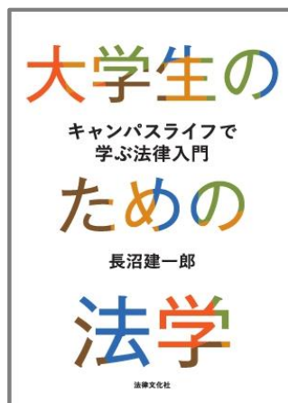
大学生のための法学