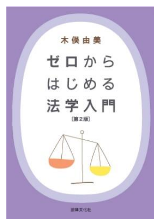
ゼロからはじめる法学入門