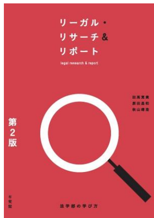
リーガル・リサーチ & リポート 第2版