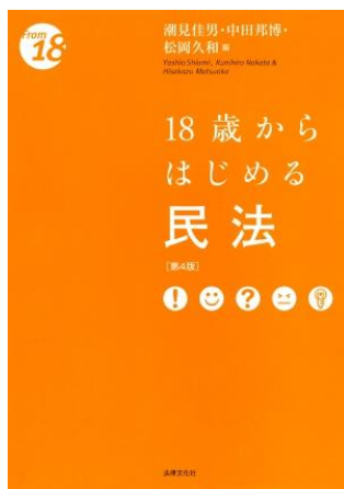
18歳からはじめる民法