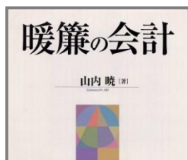
暖簾の会計 = Accounting for goodwill