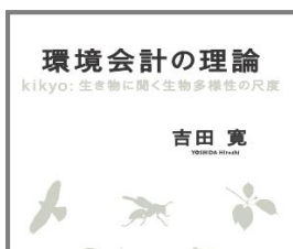
環境会計の理論 —kikyo : 生き物に 関く生物多様性の尺度—