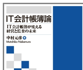
IT会計帳簿論 —IT会計帳簿が変える 経営と監査の未来—