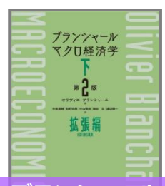
ブランシャールマクロ経済学 下 第2版