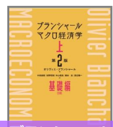
ブランシャールマクロ経済学 上 第2版