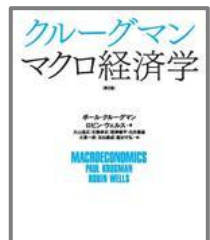
クルーグマンマクロ経済学第2版