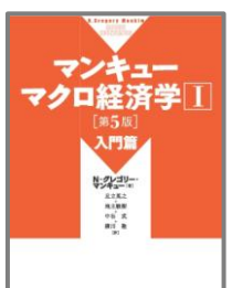
マンキューマクロ経済学 I 入門編 第5版