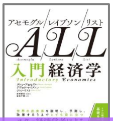
アセモグル/レイブソン/リスト 入門経済学