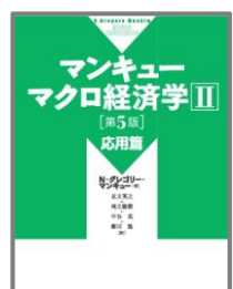
マンキZューマクロ経済学 II 応用編 第5版