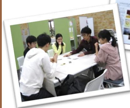
↑2019年開催のゲームイベントの様子