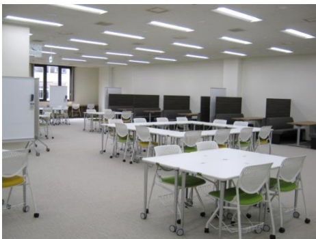
■メインコモンズ 座席数：112席+オープンPC 14席

本学の卒業生で、サンヨー食品株式会社前社長・井田毅氏（故人）を記念して設置されたセミナールームです。室内には4面マルチディスプレイなど充実した映像・音響機器が設置されています。小規模な学会発表やシンポジウム、上映会などの開催場所としても使用できます。（要予約）