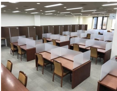
■閲覧室 座席数：101席（半個室19席を含む）

人数や目的に合わせ、室内の椅子・机やホワイトボードを自由に動かして利用することができます。他の利用者の迷惑にならない声の大きさであれば、会話も問題ありません。グループワークの課題作成やディスカッション、プレゼンテーション、複数名の打ち合わせ、個人利用も可能です。