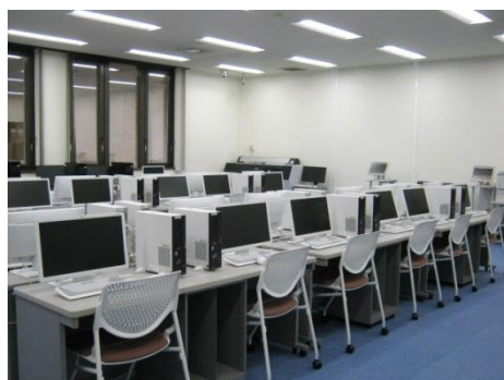
■メディアラボ 座席数：オープンPC 36席

既存の大型家具の雰囲気を活かしながら、アクリル製の仕切を設置することで、一名分の学修スペースを拡張し、他人の視線を気にすることなく、集中して学習に取り組める環境です。部屋の両側に設けた半個室では、より集中して学習に取り組むことができます。